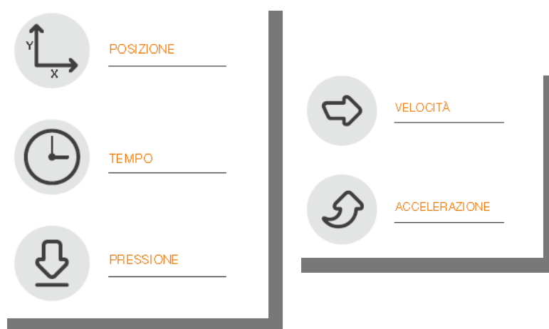
Fig.1 - Schema

E' possibile elaborare velocità e accelerazione ai fini di analisi forensi.