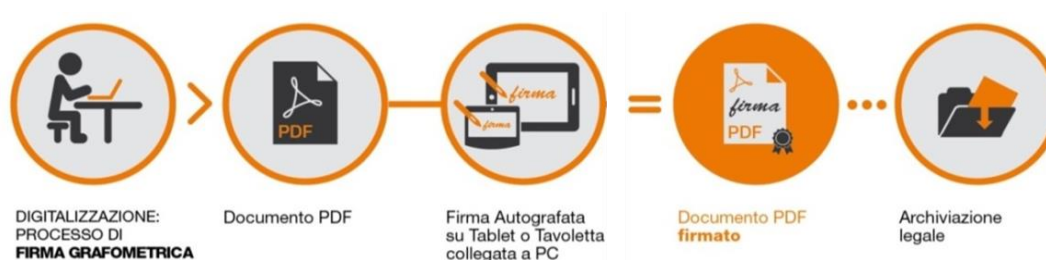
Fig.2 - Schema

I dati cifrati vengono successivamente inseriti nel pdf attraverso la creazione di una firma conforme allo standard europeo denominato PAdES. La soluzione prevede che, a sigillo di ogni firma apposta sul documento dal CLIENTE, sia applicato un certificato rilasciato da NAMIRIAL CA.